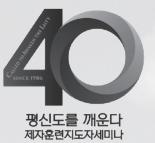
평신도를 깨운다 제자훈련지도자세미나